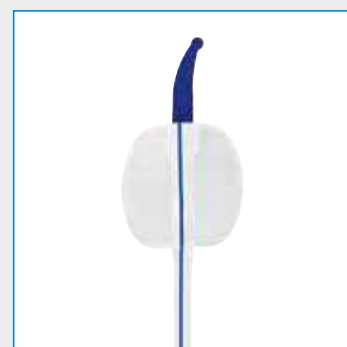
Ballonvolumen: 5-30 ml

Abbildungen können vom Original abweichen