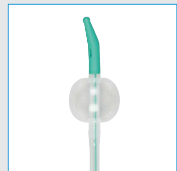
Ballonvolumen: 5-30 ml

Abbildungen können vom Original abweichen