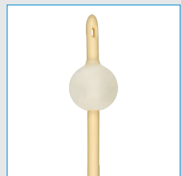
Ballonvolumen: 10-30 ml

Verpackungseinheit: 10 Stück Verpackung: steril