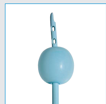
Ballonvolumen bis zu 60 ml

Verpackungseinheit: 10 Stück Verpackung: steril