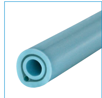
Silikonelastomer – Latexkern mit Silikonummantelung