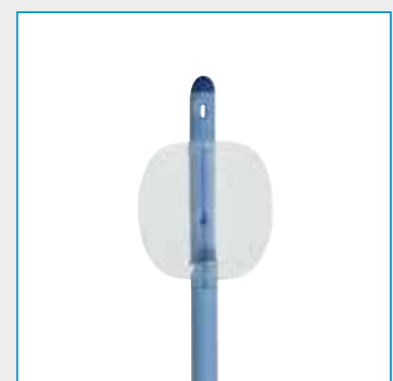
Ballonvolumen: 05-10 ml

Abbildungen können vom Original abweichen