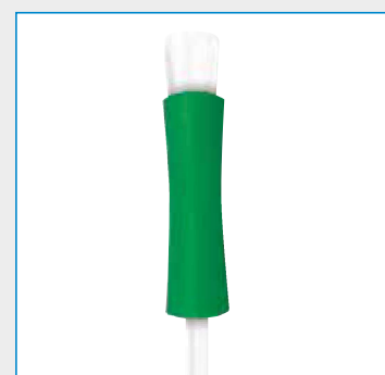
Einführhilfe Gripper bei Typ Kind und Mann

Abbildungen können vom Original abweichen