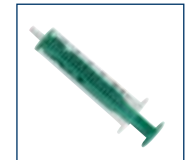
10 ml Spritze

Verpackungseinheit: 20 Stück Verpackung: steril