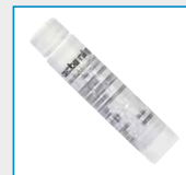
Octenisept, 15 ml