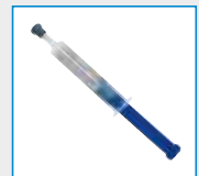
Endosgel, 6 ml