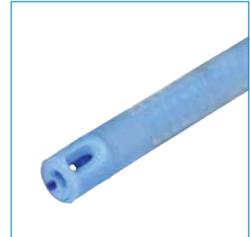
Zentral offene Spitze, integral Ballon