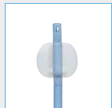
Ballonvolumen: 05-10 ml

Abbildungen können vom Original abweichen