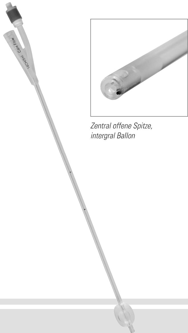
Zentral offene Spitze, integral Ballon