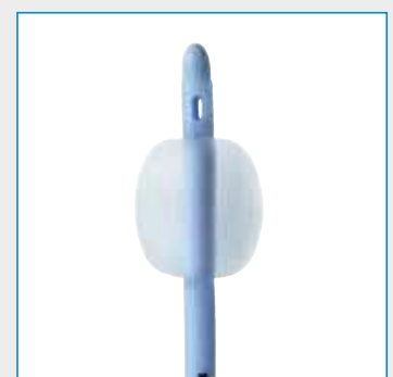
Ballonvolumen: 05-10 ml

Abbildungen können vom Original abweichen