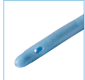
Dilatationsspitze mit zentraler Bohrung, integral Ballon