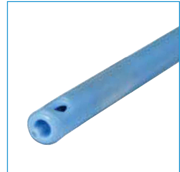
Zentral offene Spitze, integral Ballon