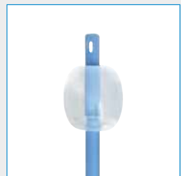
Ballonvolumen: 05-10 ml

Abbildungen können vom Original abweichen