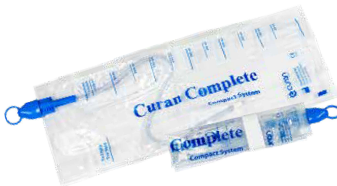
Curan Complete Kompaktsystem Auffangbeutel: 1.000 ml HMN 15.25.14.8001