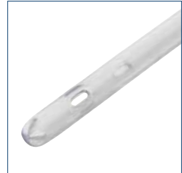
Atraumatische, abgerundete Drainageaugen